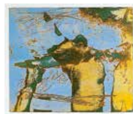
Jubileumsvinst nr 363. Färgetsning Formationer , 24x29 cm av Mia Jarnsjö.