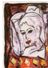
Maya , färglitografi av Torsten Jurell. 2014. Pris 2500:- 42 x 30 cm.