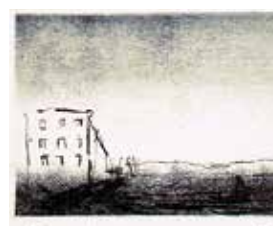
Jubileumsvinst nr 394-397. Etsning Huset , 15x19 cm av Anders Gudmundsson.