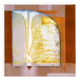
Jubileumsvinst nr 361. Collografi Spelrum , 34x32 cm av Kersti Rågfeldt-Strandberg.