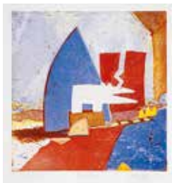
Jubileumsvinst nr 383-385. Färgetsning Solipsist , 27x26 cm av Lars Rylander.