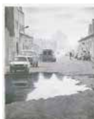
Very wet street , färglitografi av Mikael Kihlman. 2002. Pris 1800:- 44 x 34 cm.