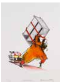
Jubileumsvinst nr 364. Färglitografi Samlaren , 38x28 cm av Olle Qvennerstedt.