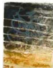
Nattsudd , färglitografi av Måns Heidvall. 1988. Pris 1000:- 67 x 50 cm.