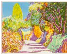
Jubileumsvinst nr 356. Färglitografi Katedral I , 31x40 cm av Björn Wessman.