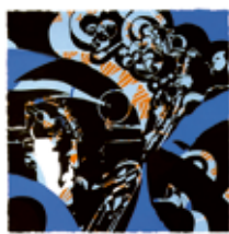
Salute to Lester , serigrafi av Knut Grane. 1994. Pris 1500:- 48 x 48 cm.