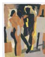
I Ateljén , serigrafi av Kévork Zabounian. 1999. Pris 2400:- 49 x 38 cm.