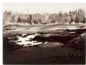
Jubileumsvinst nr 370. Torrnålsetsning Jord , 16x20 cm av Leif Olausson.