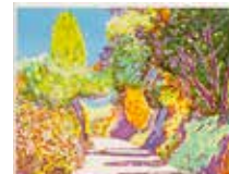
Katedral I , färglitografi av Björn Wessman. 2008. Pris 2200:- 31 x 40 cm.