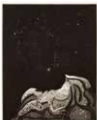
Stjärnhimmel , etsning akvatint av Stefano Beccari. 1985. Pris 1000:- 47 x 38 cm.