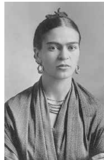
Frida Kahlo.