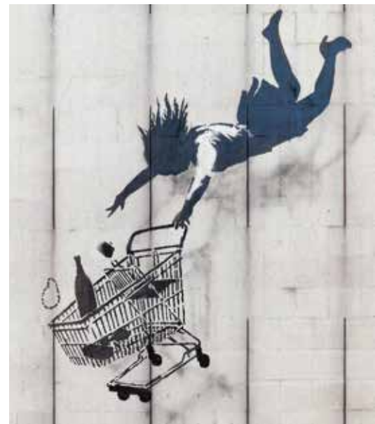
Banksy, Shop 'til You Drop, Barlow Lane, London.