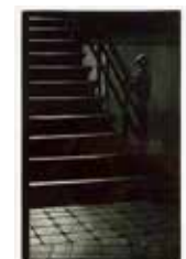
Tyst morgon , mezzotint av Jukka Vänttinen. 2005. Pris 1600:- 25 x 16 cm.