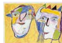
Narrarnas afton , färglitografi av Jörgen Nash. 1993. Pris 2000:- 50 x 70 cm.