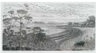
Jubileumsvinst nr 366. Trägravyr Strandäng, Öland , 14x27 cm av Eva Stockhaus.