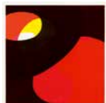
Utan titel , serigrafi av Magdolna Szabo. 2006. Pris 1700:- 24 x 24 cm.