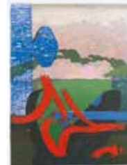
Landskapets drama och hemlighet , färglitografi av CO Hultén. 1998. Pris 2500:- 53 x 39 cm.