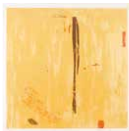
Jubileumsvinst nr 362. Färglitografi Spejare , 40x38 cm av Roger Simonsson.