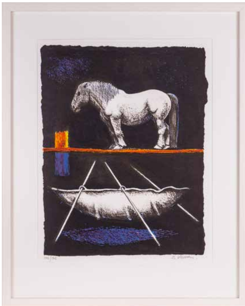
Vinst nr 45-185. Färglitografi Passage , 27x36 cm av Bertil Vallien.

Bertil Vallien är 2015 års storkonstnär i JFF Konst vinstlista: