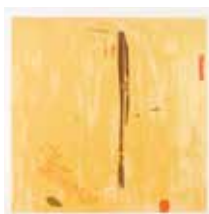
Spejare , färglitografi av Roger Simonsson. 2004. Pris 1800:- 40 x 38 cm.