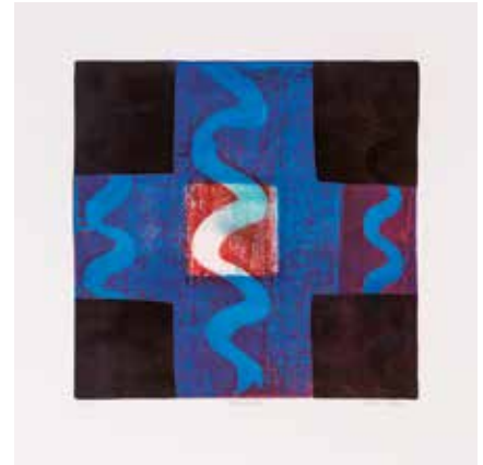
Vinst nr 340. Etsning Vägskäl 1 , 23x23 cm av Ulli Evans som har studerat vid Grafikskolan och Konsthögskolan i Stockholm. Flertal utställningar i Sverige och England. Representerad bl a vid Moderna Museet Stockholm och British Museum, London.