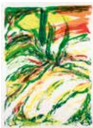
Jubileumsvinst nr 351-354. Färglitografi Höstljus , 59x43 cm av Bengt Olsson.