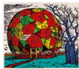
Jubileumsvinst nr 357. Färgträsnitt Bubblan , 39x46 cm av Fredrik Lindqvist.