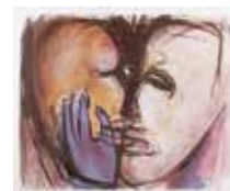
Kysen , färglitografi i 6 färger av Ann Wolff. 2000. Pris 2400:- 47 x 57 cm.