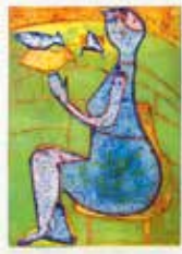
Dam med fåglar , collografi av Fia Kvissberg. 2009. Pris 1800:- 29 x 21 cm.