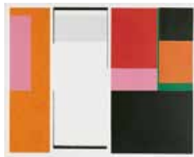
Jubileumsvinst nr 355. Seriegrafi Fasad I , 30x38 cm av Nils Köläre.