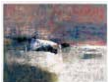
Utan titel , serigrafi av Anders österlin. 1996. Pris 1800:- 43 x 56 cm.