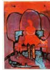
Sittande , collografi av Fia Kvissberg. 2009. Pris 1800:- 29 x 21 cm.