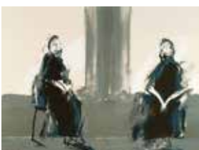
Jubileumsvinst nr 374-377. Färglitografi Två kvinnor , 60x45 cm av Örjan Wikström.