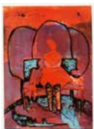
Jubileumsvinst nr 360. Collografi Sittande , 29x21 cm av Fia Kvissberg.