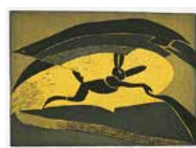
Jubileumsvinst nr 371-373. Färgetsning Stenhare , 45x30 cm av Nils G Stenqvist.