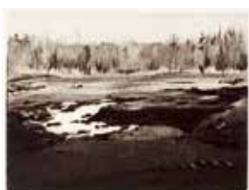
Jubileumsvinst nr 387-389. Torrnälssetsning Jord , 16x20 cm av Leif Olausson.