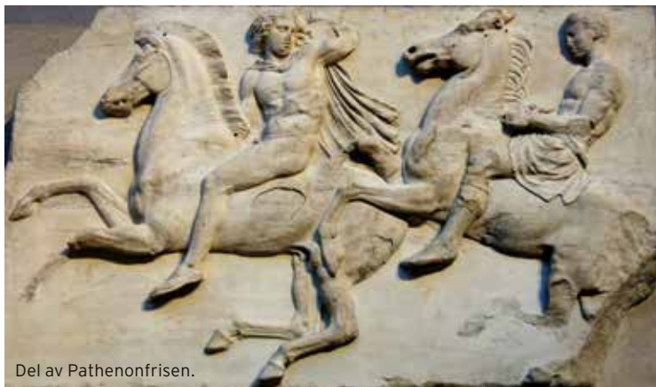
Del av Parthenonfrisen.