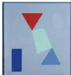
Jubileumsvinst nr 359. Seriegrafi Figurspel I , 41x38 cm av Ingela Palmertz.