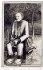
Melankolivariation II , stålstick av Richard Ärlin. 2006. Pris 1000:- 9 x 6 cm.