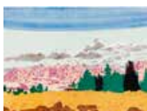
Outlandish , färgitografi av Roger Metto. 2010. Pris 3000:- 28 x 38 cm.