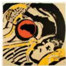
Salute to Charlie , serigrafi av Knut Grane. 1994. Pris 1500:- 48 x 48 cm.