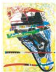
Hästens fågel , färglitografi av Liz Zwick. 1995. Pris 2000:- 63 x 49 cm.