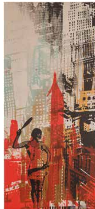
Vinst nr 12. Akryl/seriegrafi Utan titel , 22x49 cm av Ulrika Andersson , från Fagersta. Hon är utbildad vid Konsthögskolan, Konstfack och Grafikskolan i Stockholm och hennes verk finns representerade vid Moderna Museet och Nationalmuseum i Stockholm samt vid British Museum i London.

Vinst nr 1. Skulptur, sandgjutet glas, Väktare , 14x34x14 cm av Bertil Vallien . Konstnären presenteras utförligt i artikel och faktaruta, se sid 6.