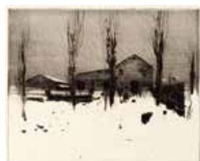
Jubileumsvinst nr 390-392. Torrnälssetsning Blidväder , 20x25 cm av Leif Olausson.