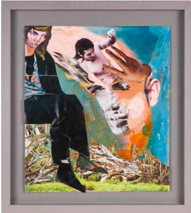
Vinst nr 4. Collage Utan titel , 24x27 cm av Eva Zettervall , född 1941 i Boden, verksam i Stockholm. Eva har bland annat utfört konstnärlig utsmyck- ning av Mariatorgets tunnelbanestation i Stockholm.