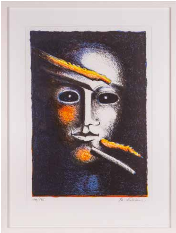
Vinst nr 186-326. Färglitografi Mirage , 26x40 cm av Bertil Vallien.