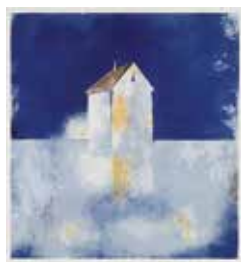
Jubileumsvinst nr 378. Färglitografi Blå stund , 29x26 cm av Maria Lager.