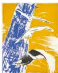
Fågeltorn , färgetsning akvatint av Ulf Trotzig. 2003. Pris 3000:- 50 x 40 cm.