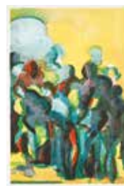
Jubileumsvinst nr 380-382. Färglitografi Samman , 45x30 cm av Elisabeth Jansson.