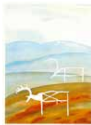
Jubileumsvinst nr 368. Färglitografi Tecken , 37x27 cm av Eva Ljungdahl.