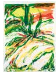
Höstljus , färglitografi av Bengt Olson. 2005. Pris 3500:- 59 x 43 cm.