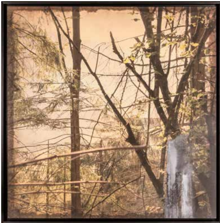
Vinst nr 3. Foto/akryl Utan titel , 60x61 cm av Bent Holstein från Danmark, som arbetar mot en internationell konstpublik. Bent har bland annat ställt ut sina verk i Paris, Stavanger, Köpenhamn, Palo Alto (Kalifornien), Karlsruhe (Tyskland) och i Göte- borg.