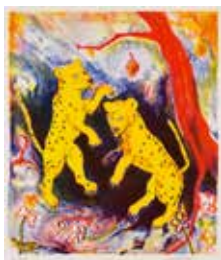
Jubileumsvinst nr 358. Färglitografi Kattdjur under träd , 40x34 cm av Susanne Nessim.