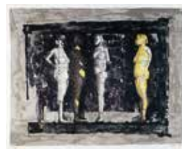
Jubileumsvinst nr 369. Färglitografi Karyatid I , 40x50 cm av Sture Meyer.