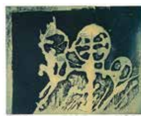
Jubileumsvinst nr 393. Färgetsning Monte Bego III , 24x30 cm av Lone Recht.