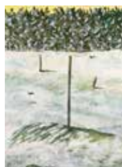
Nysnö , serigrafi av Ulf Gripenholm. 1993. Pris 2500:- 53 x 37 cm.