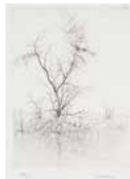
Jubileumsvinst nr 386. Torrnål Stilla , 12x9 cm av Lars Nyberg.