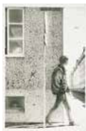
Jubileumsvinst nr 379. Torrnälsgravyr Hörnet , 19x13 cm av Björn Brusewitz.