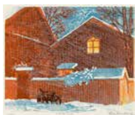
Jubileumsvinst nr 367. Färgträsnitt Första snön , 21x24 cm av Kjell Sundberg.