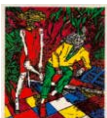
Samtal , färgträsnitt av Fredrik Lindqvist. 2012. Pris 2000:- 44 x 39 cm.