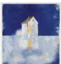
Blå stund , färglitografi av Maria Lager. 2007. Pris 1000:- 29 x 26 cm.