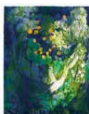
Korallbrant , färggravyr av Brita Molin. 1995. Pris 1800:- 44 x 35 cm.