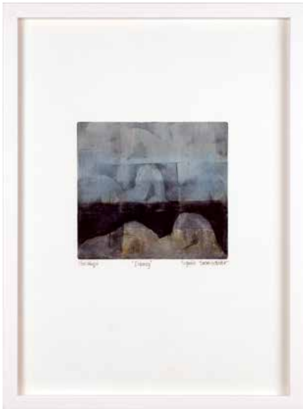
Vinst nr 337. Monotypi Isberg , 14x15 cm av Sigrun Sverrisdottir, född 1949 och utbildad vid Konst- och Konsthantverksskolan i Reykjavik. Bosatt i Sverige sedan 1977.