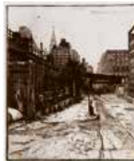
New York (The High Lines) , etsning av Hasse Lindroth. 2007. Pris 1800:- 29 x 24 cm.