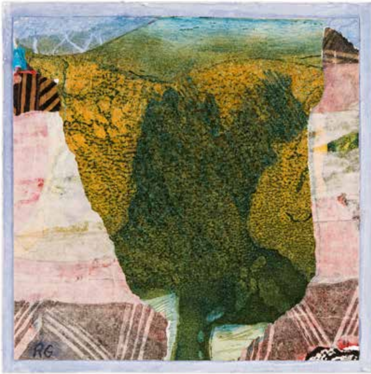
Vinst nr 32. Collage Skiss från grekisk resa 2 , 19x19 cm av Ruth Goldmann, svensk målare och grafiker, född 1941. Ruth studerade vid Konstfack och Konsthögskolan i Stockholm och har också vidareutbildat sig i Paris.