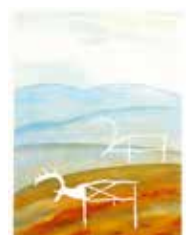
Tecken , färglitografi av Eva Ljungdahl. 2003. Pris 1100:- 37 x 27 cm.