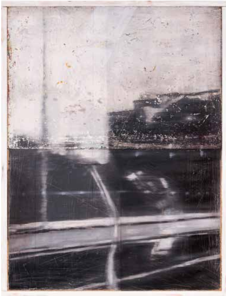
Vinst nr 2. Olja Ögonblicket 1 , 30x40 cm av Tomas Gustavsson , född 1958, utbildad vid Västerås Konstskola och Konstfack i Stockholm. Har främst ställt ut sina verk i Västerås och Stockholm.