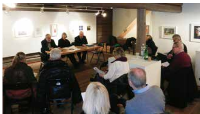
För första gången höll JFF Konst årsmöte i direkt anslutning till utlottningen av förra årets konstinköp.

En stämning av stor förväntan lägrar sig över lokalen under utlottningen - känner man någon av