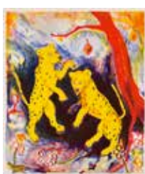
Kattdjur under trädet , färglitografi, av Susanne Nessim. 2011. Pris 2300:- 40 x 34 cm.