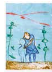
Vi två , collografi av Fia Kvissberg. 2009. Pris 1800:-, 29x21 cm