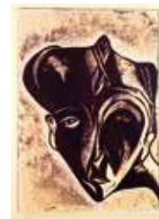
Det röda ögat , färglitografi, akvatint av Channa Bankier. 1987, Pris 1 600:-, 65x50 cm.