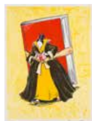
Inbunden , färglitografi av Olle Qvenerstedt. 2011. Pris: 1500:- 38 x 28 cm.