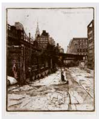
Vinst nr 349-351. Etsning, 29x24. New York (the High Lines) av Hasse Lindroth.