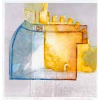
Vinst nr 326-332. Collografi 26x25. Rådrom av Kersti Rågfelt Strandberg. Bildkonstnär och grafiker. Född 1945 i Umeå. Bosatt i Södertälje. Hon är yrkesverksam som konstnär sedan början på 1980-talet. Hon arbetar främst med akvarell och grafik.