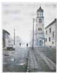
Samokov , färglitografi av Mikael Kihlman. 2002. Pris 1 800:-, 44x34 cm