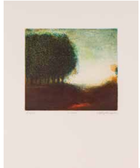
Vinst nr 300-306. Etsning, 27x35. Lugna av Stephen Lawlor . Född 1958, från Dublin, Irland. Är i sitt konstnärskap bland annat påverkad av de stora renässanskonstnärerna.