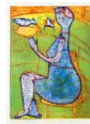
Dam med fåglar , collografi av Fia Kvissberg. 2009. Pris 1800:-, 29x21 cm.