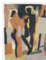
I Ateljén , seriegrafi av Kévork Zabounian. 1999. Pris 2400:- 49 x 38 cm.