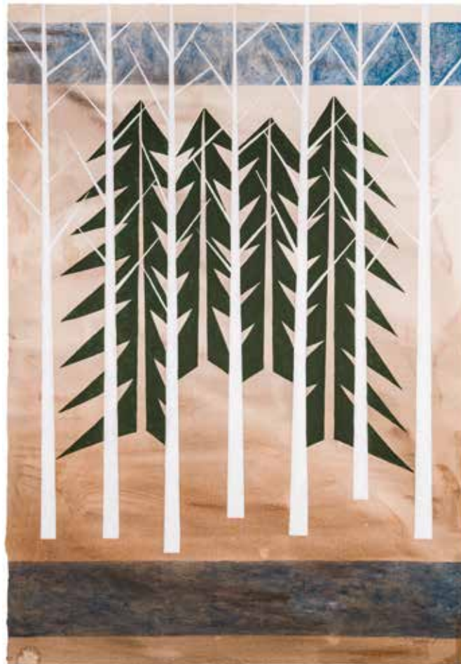
Vinst nr 1. Akryl på akvarellpapper 51x74, Träd av Maria Thorin.