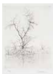
Stilla , tornålsgravur av Lars Nyberg. 1999. Pris 900:-. 12x9 cm