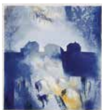
Hus på höjden , färglitografi av Maria Lager. 2007. Pris 1 000:-, 29x26 cm.