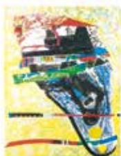
Hästens fågel , färglitografi av Liz Zwick, 1995. Pris 2000:- 63 x 49 cm.