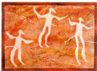
Vinst nr 389-399. Färglitografi, 27x37. Fågelmannen av Eva Ljungdahl.