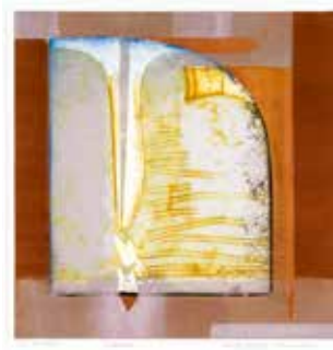
Vinst nr 333-337. Collografi, 26x25. Spelrum av Kersti Rågfelt Strandberg.