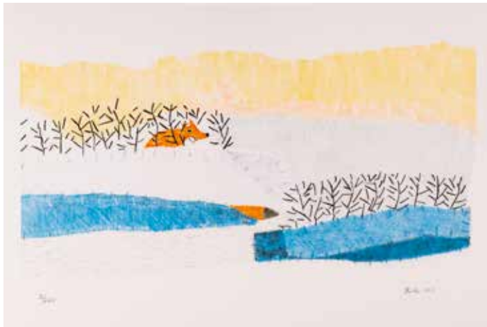
Vinst nr 289. Litografi, 42x20. Listigt av Britta Marakatt Labba.