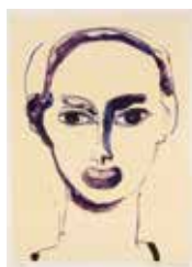
Grace , färglitografi av Torsten Jurell. 2014. Pris 2 500:-, 42x30 cm.