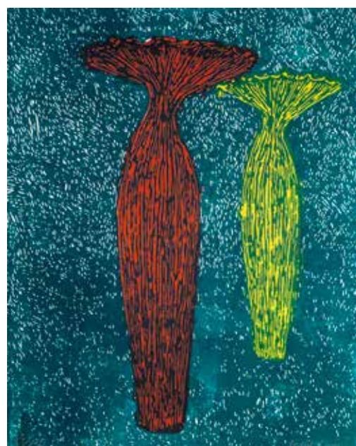
Vinst nr 321. Träsnitt, 39x50. Ljus av Fredrik Lindqvist. Född 1968 i Kristianstad. Akademisk konstnärutbildning i Umeå och Düsseldorf Tyskland. Fredrik arbetar med ett starkt formspråk. Hans verk andas en intensiv längtan efter äventyr och liv.