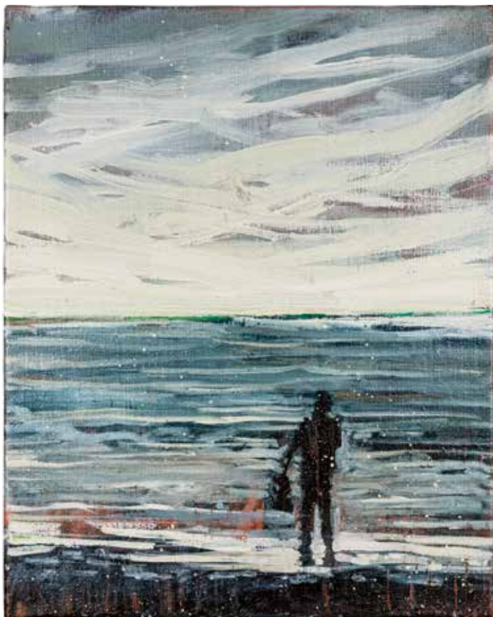
Vinst nr 4. Olja på duk, 28x36. Seaford av Joseph Davey . Han är född i Storbritannien och har en treårig universitetsutbildning i Fine Arts från Brighton. Davey jobbar mycket med landskap, för hans del är färger och ljus det centrala i gestaltningen av motivet.