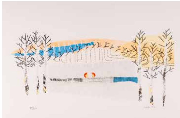
Vinst nr 290. Litografi, 42x20. Vi av Britta Marakatt Labba.