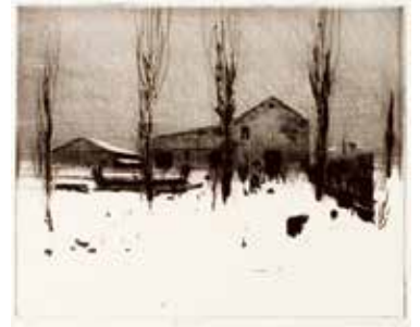
Vinst nr 385-387. Torr nåls etsning, 20x25. Bildväder av Leif Olausson.