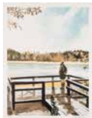
The fall , färglitografi av Pär Strömberg. 2018. Pris 2 700:-, 38x50 cm.