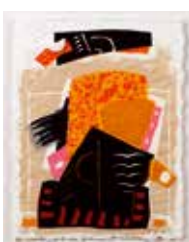
Metiss age X , litografi med relieftryck av Alain Soucasse. 2006. Pris 1000:- 18 x 23 cm.