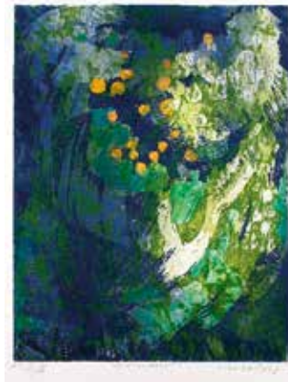
Vinst nr 298 och 342. Färggravyr, 44x35. Korallbrant av Brita Molin, född 1919 i Skara, död 2008 i Stockholm. Utbildad på Académie Libre, Konstfackskolan i Stockholm och Kungliga Konsthögskolan i Stockholm. Hon var under slutet av 1980-talet huvudlärare i grafik på Konsthögskolan Valand.