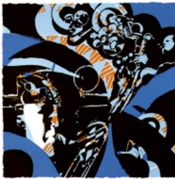
Vinst nr 358-360. Serigraf, 48x48. Salute to Lester av Knut Grane.