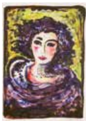
Dam i svart , färglitografi av Torsten Jurell. 2014. Pris 2500:- 41 x 28 cm.