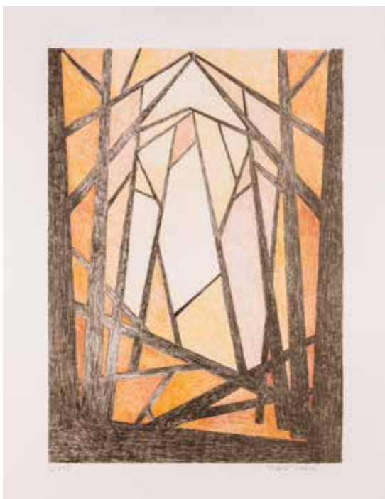
Vinst nr 9 - 148. Färglitografi, 37x52. Efter stormen av Maria Thorin.