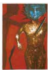
Kvinna med dolk , färglitografi av Eva Zettervall. 1990. Pris 1600:- 44 x 30 cm.