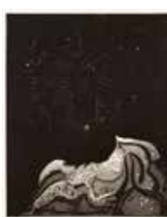
Stjärnhimmel , etsning akvatint av Stefano Beccari. 1985. Pris 1000:- 47 x 38 cm.