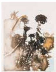
Dahlia , färglitografi av Pär Strömberg. 2018. Pris 2 700:-, 38x50 cm.

Alla konstverk är presenterade i respektive årsskrift.