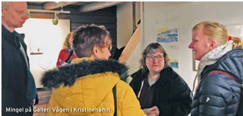
Mingel på Galleri Vågen i Kristinehamn.