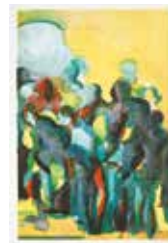
Samman , färglitografi av Elisabeth Jansson. 1998. Pris 1300:- 45 x 30 cm.