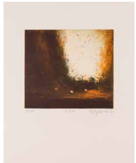
Vinst nr 307-317. Etsning, 27x35. Rytm av Stephen Lawlor .