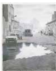
Very wet street , färglitografi av Mikael Kihlman. 2002. Pris 1800:- 44 x 34 cm.