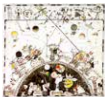
Spöksår , handkolorerad etsning och blandteknik av Jorgo Krallis. 1988, Pris 1 600:-, 37x40 cm.