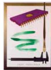
Chip challenge , färglitografi av Sture Johannesson. 1981. Pris 2 000:-, 55 x 40 cm