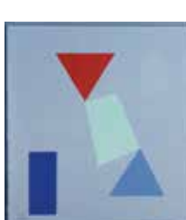
Figurspel I , seriegrafi av Ingela Palmertz. 2003. Pris 2 200:-, 41x38 cm.