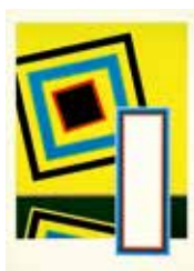
Spegling , seriegrafi av Peter Freudendahl. 1991, Pris 2 000:-, 54 x 39 cm.