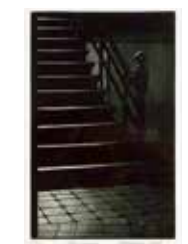
Tyst morgon , mezzotint av Jukka Vänttinen. 2005. Pris 1600:- 25 x 16 cm.