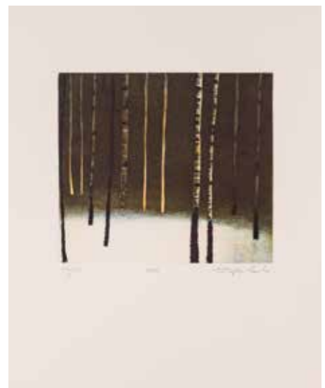
Vinst nr 318-320. Etsning, 27x35. Träd av Stephen Lawlor .