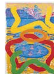
Källan , seriegrafi i 14 färger av Roland Ljungberg. 2000. Pris 1000:- 50 x 35 cm.