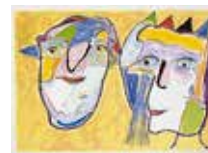
Narrarnas afton , färglitografi av Jörgen Nash. 1993. Pris 2000:- 50 x 70 cm.