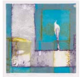
Vinst nr 338-341. Collografi, 26x25. Andrum av Kersti Rågfelt Strandberg.