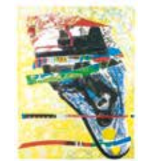
Hästens fågel , färglitografi av Liz Zwick, 1995. Pris 2000:- 63 x 49 cm.