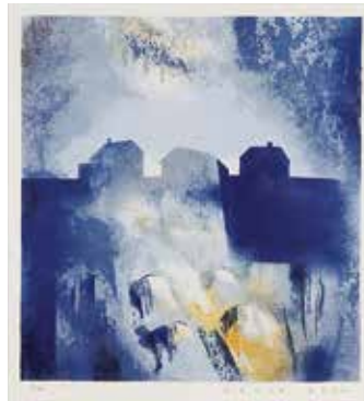
Hus på höjden , färglito-grafi av Maria Lager, 2007.

Så var det också dags för föreningen att ta steget ut i cyberrymden. 2009 framställa en egen "hemsida" på internet. Modernt och bra tycker nog många. Nu i år 2008 kan också konstateras att värvningskampanjen som startade förra året gav 100 nya medlemmar. Positivt! Årets storutgåvor är utförda av Björn Wessman, Stockholm, trefaldigt