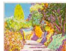
Katedral I , färglitografi av Björn Wessman, 2008. Pris 2200:- 31 x 40 cm.