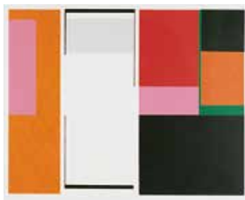
Vinst nr 287-291. Serigrافی. " Fasad I ", 30 x 38 av Nils Kölare. 2002.