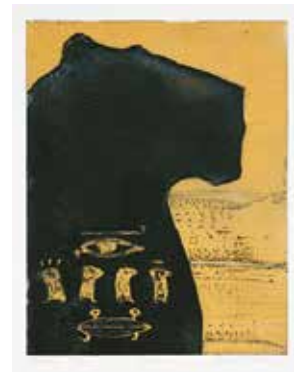
Vinst nr 358-362. färgetsning, Thebe , 31 x 25 av Maria Collinder. 1998.