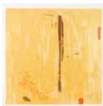
Spejare , färglitografi av Roger Simonsson. 2004. Pris 1800:- 40 x 38 cm.