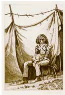
Vinst nr 302-306. Kopparstick, " Vad hände med Ethel Merrit 1 ", 25 x 17, av Åke Johansson. 2008.

Åke Johansson, en av landets främste kopparstickare. Född 1948. Utbildad på grafiskskolan Forum i Malmö.