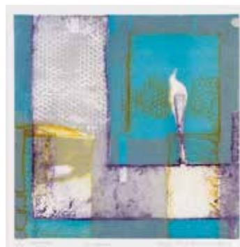
Vinst nr 332-336. Collogrافی, Andrum , 26x25 cm av Kersti Rågfeldt. 2005. Representerad bl a i Sveriges Riksdag.

Roger Metto åter-skapar en drömmens geografi, där Lapplands vidder gränsar till Klippiga bergen och människan är oansenlig inför sin omgivning.