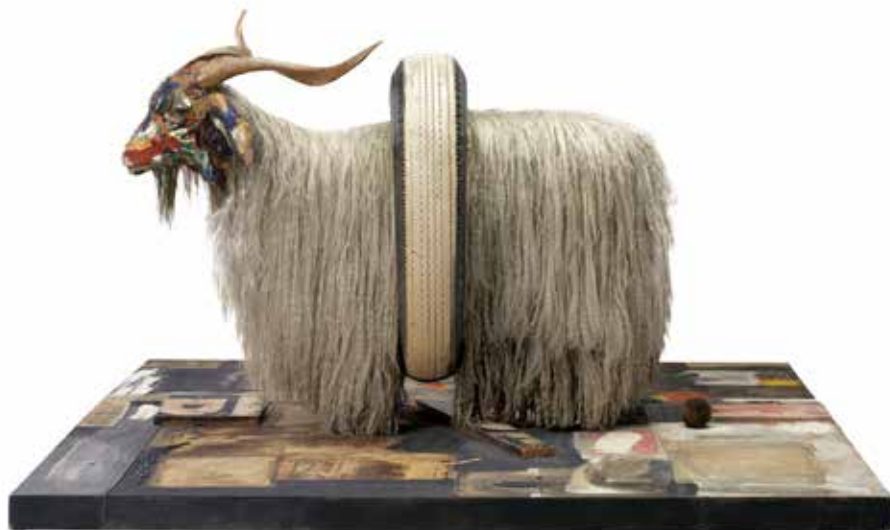
Robert Rauschenberg, Monogram, 1955-59

VARMT VÄLKOMMEN TILL EN INSPIRERANDE KONSTHÄNDELSE!