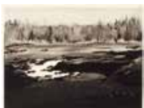
Jord , torr nålsgravyr av Leif Olausson. 2004. Pris 1200:- 16 x 20 cm.