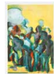
Elisabeth Jansson "Samman" färglitografi, storutgåva 1998, 45x30 cm, värde 1300:-