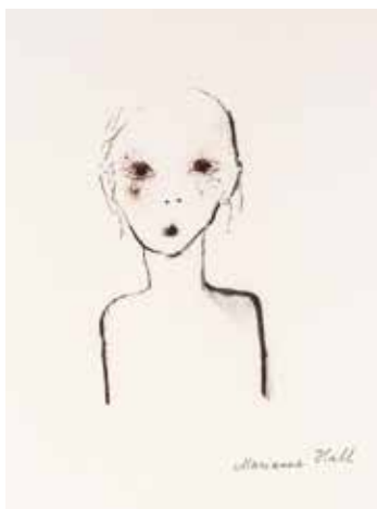
Vinst nr 300. Kol och krita, Utan titel , 29 x 20 av Marianne Hall . Född 1936, Bor i Stockholm. Utbildad vid Konstakademien 1964-70 och Konstfackskolan, skulptur 1961-64.