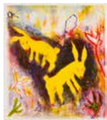
Kaniner leker , färglitografi av Susanne Nessim. 2011. Pris 2300:- 40 x 34 cm.