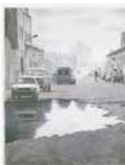
Very wet street , färglitografi av Mikael Kihlman. 2002. Pris 1800:- 44 x 34 cm.