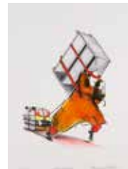
Samlaren , färglitografi av Olle Qvennerstedt. 2011. Pris 1500:- 38 x 28 cm.