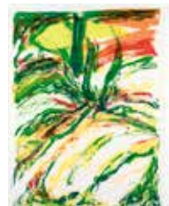
Höstljus , färglitografi av Bengt Olsson. 2005. Pris 3500:- 59 x 43 cm.