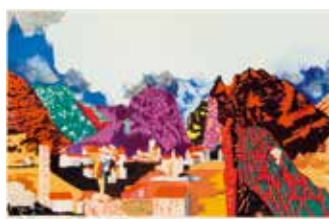
Vinst nr 282-286. Färgitografi, Aura , 18 x 29 av Roger Metto. 2010.

Roger Metto åter-skapar en drömmens geografi, där Lapplands vidder gränsar till Klippiga bergen och människan är oansenlig inför sin omgivning.