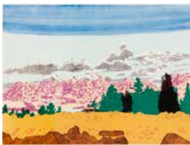
Vinst nr 16-25. färgitografi, Outlandish , 28 x 38 av Roger Metto. 2010.