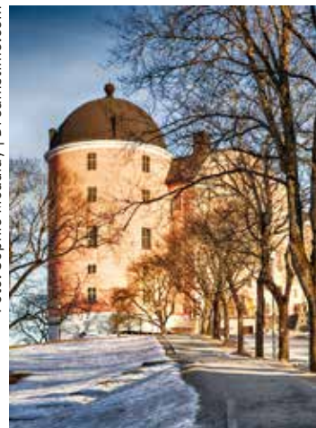
Plats för grafiktriennial