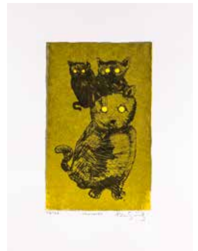
Vinst nr 357. Seriegrafi, Välkommen , 25 x 15 av Pär Sundling . Född 1963 och bosatt, verksam och också utbildad i Stockholm, bl.a. på Grafikskolan (1990-93).