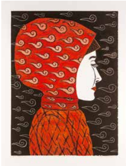
Vinst 29. Akvallerat träsnitt, Min mössa , 42 x 30 av Ulla Wennberg . Utbildad på Konsthögskolan i Stockholm, jobbar med grafik, teckningar, collage, akvareller och ord.