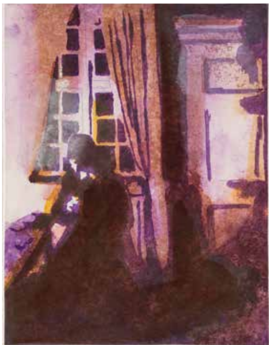
Vinst nr 15. Gouache, I skuggan , 26 x 20 av Örjan Wikström . Född 1948 i Stockholm. Bosatt i Paris och Stockholm. Utbildad vid Konstfack, Stockholm och Konstakademien, Paris.