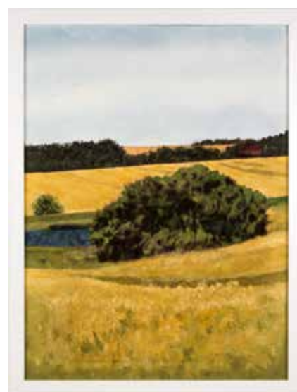
Vinst 9. Målning, Backlandskap mot väst , 40 x 30 av Christer Lidhäll . Född 1955, verksam och bosatt i Stockholm. Christers målningar kan liknas vid vackert diffusa minnesbilder. Med associationer, fragment och minnen från något som passerat och skapat intryck. Ögonblicket likt fotografier, men utan fotografiets skärpa.