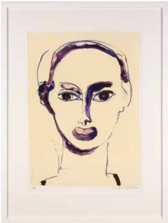
Vinst nr 219-281. Färglitografi, Grace , 42 x 30 av Torsten Jurell .