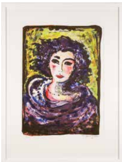
Vinst 93-155. Färglitografi, Dam i svart , 41 x 28 av Torsten Jurell.

man inte kan förstå allt. Men lägg lite ansträngning på att ändå vilja förstå och skrapa på ytan, säger Torsten Jurell innan våra vägar skiljs åt.