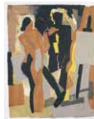
I Ateljén , serigraf av Kévork Zabounian. 1999. Pris 2400:- 49 x 38 cm.