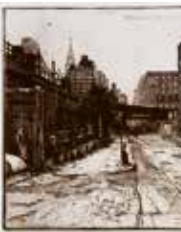
New York (The High Lines) , etsning av Hasse Lindroth. 2007. Pris 1800:- 29 x 24 cm.