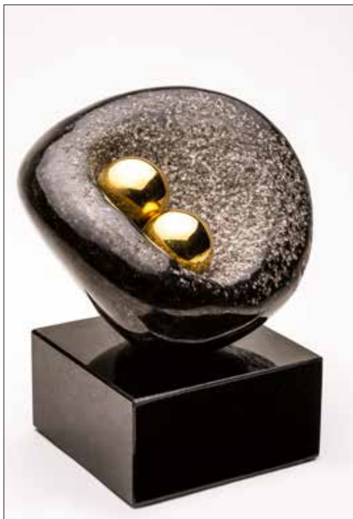
Vinst nr 8. Brons och sten, Svensk dröm , 16 x 15 x 13 av Flemming Holm .

Strax norr om Hjørring i Danmark finns Flemming Holms ateljé. Flemming Holm förvandlar grova granitblock till eleganta skulpturer, men han använder också brons och marmor i sina arbeten.