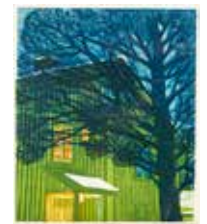
Kjell Sundberg "Kall morgon" färgträsnitt, storutgåva 2009, 24x20 cm, värde 1400:-