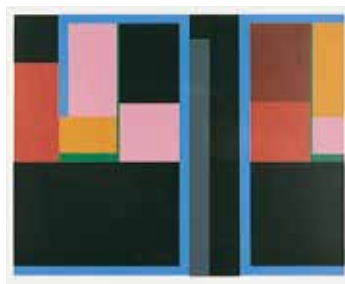
Vinst nr 292-296. Serigrافی. " Fasad II ", 30 x 38 av Nils Kölare. 2002.

Nils Kölare (1930-2007) utbildad vid Konstfack i Stockholm 1953-57. Representerad bl a i Nationalmuseum, Moderna Museet Stockholm och Norrköpings konstmuseum.