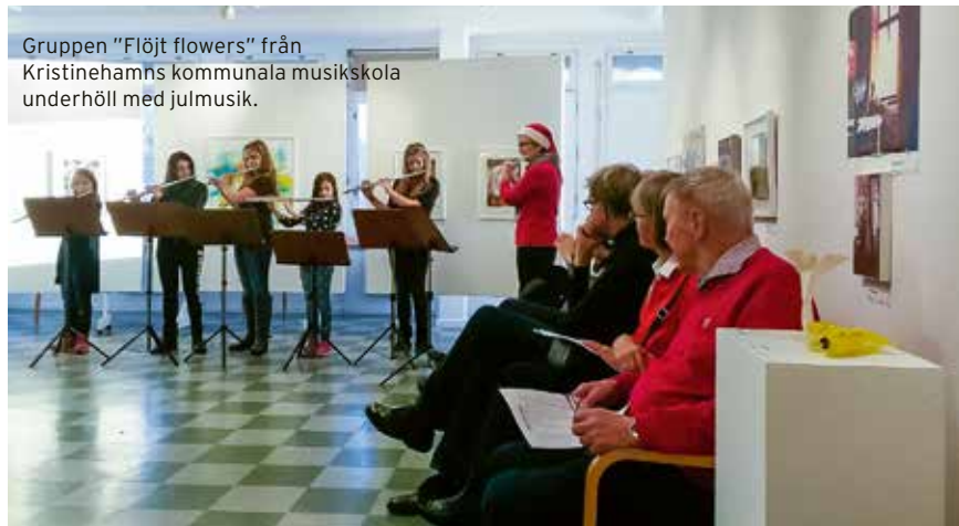
Gruppen "Flöjt flowers" från Kristinehamns kommunala musikskola underhöll med julmusik.