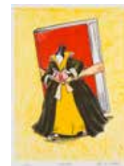
Olle Qvennerstedt "Inbunden" färglitografi, storutgåva 2011, 38x28 cm, värde 1500:-