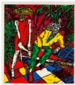
Vinst nr 322-331. Färgträsnitt, Samtal , 44 x 39 av Fredrik Lindqvist. 2012.