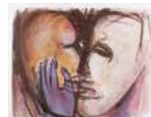
Kysen , färglitografi i 6 färger av Ann Wolff. 2000. Pris 2400:- 47 x 57 cm.