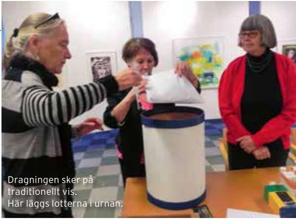
Dragningen sker på traditionellt vis. Här läggs lotterna i urnan.