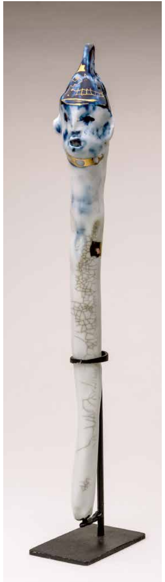
Vinst nr 1. Skulptur, porslin, Marionett i blått , 30 x 4 x 7 av Torsten Jurell.