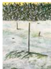
Nysnö , serigraf av Ulf Gripenholm. 1993. Pris 2500:- 53 x 37 cm.