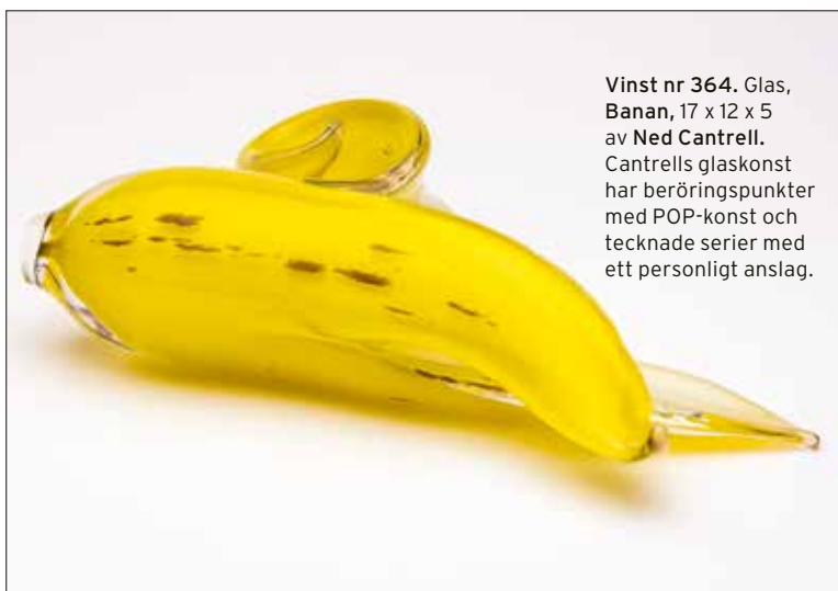
Vinst nr 364. Glas, Banan , 17 x 12 x 5 av Ned Cantrell .

Cantrells glaskonst har beröringspunkter med POP-konst och tecknade serier med ett personligt anslag.