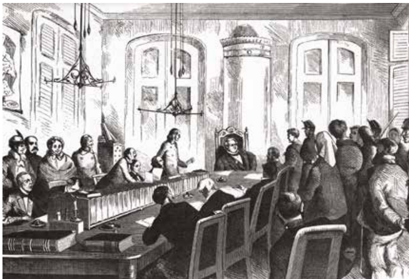
En xylografi från 1877 av John Beer (session vid Stockholms rådhusrätt).

Nr 6. Ungefär var tredje år anordnas i Sverige en stor grafikutställning för i Sverige verksamma grafiker, Grafiktriennalen, var visades den 2014?