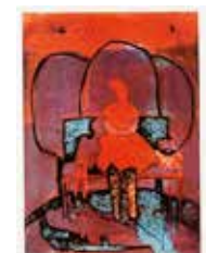
Sittande , collografi av Fia Kvissberg, 2009. Pris 1800:- 29 x 21 cm.