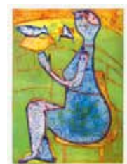
Dam med fåglar , collografi av Fia Kvissberg, 2009. Pris 1800:- 29 x 21 cm.