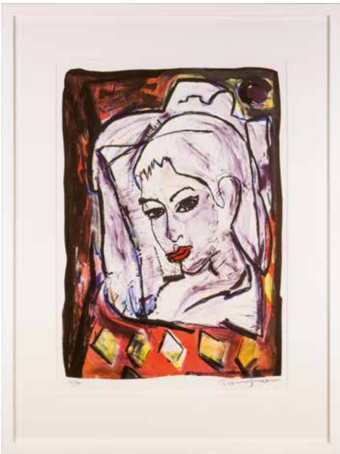
Vinst nr 156-218. Färglitografi, Maya , 42 x 30 av Torsten Jurell.

Nu är han aktuell både för årets storupplagor och för förstapriset, skulpturen Marionett i blått, porslin.