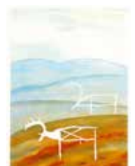
Tecken , färglitografi av Eva Ljungdahl. 2003. Pris 1100:- 37 x 27 cm.