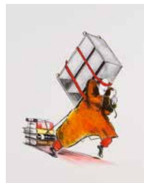
Vinst nr 347-356. Färglitografi, Samlaren , 38 x 28 av Olle Qvennerstedt. 2011.