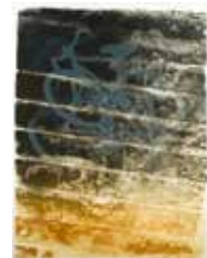
Nattsudd , färglitografi av Måns Heidvall, 1988. Pris 1000:- 67 x 50 cm.