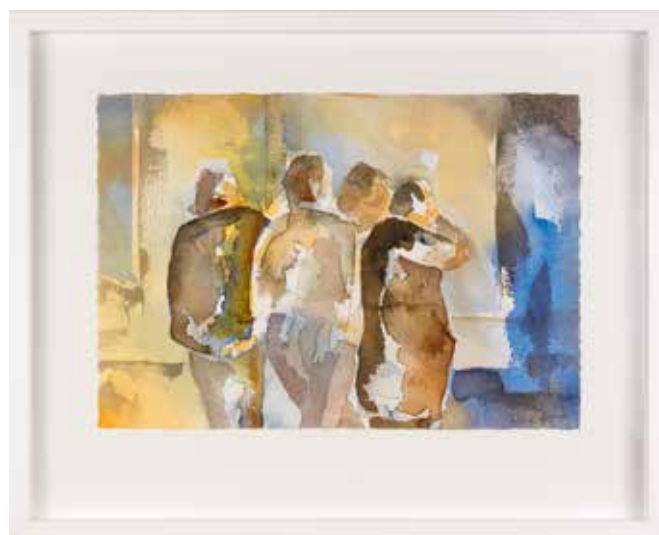
Vinst nr 26. Akvarell, Utan titel , 23 x 33 av Owe Fernquist .