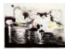
Sjöslag , färglitografi av Ralph Lundquist. 1987. Pris 800:- 41 x 56 cm.