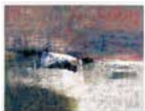
Utän titel , serigraf av Anders österlin. 1996. Pris 1800:- 43 x 56 cm.