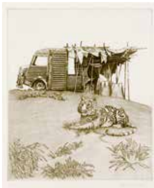
Vinst nr 307-311. Kopparstick, " Vad hände med Ethel Merrit 2 ", 24 x 21. Likaså av Åke Johansson 2008.