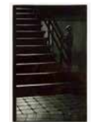
Tyst morgon , mezzotint av Jukka Vänttinen. 2005. Pris 1600:- 25 x 16 cm.