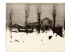
Leif Olausson "Blidväder" tornålsgravyr, storutgåva 2004, 20x25 cm, värde 1200:-