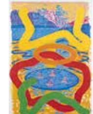
Källan , serigraf i 14 färger av Roland Ljungberg. 2000. Pris 1000:- 50 x 35 cm.