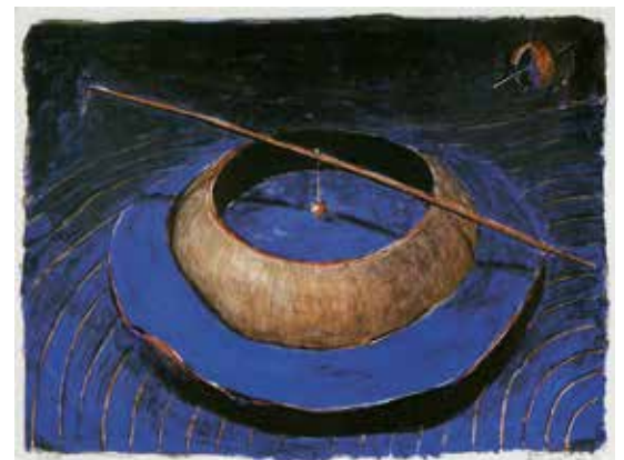
Japansk trädgård , färglitografi av Björn Krestesen. Vinst nr 23 - 292 i 1989 års utlottning. 59 x 78 cm.