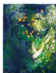
Koralbrant , färggravyr av Brita Molin. 1995. Pris 1800:- 44 x 35 cm.