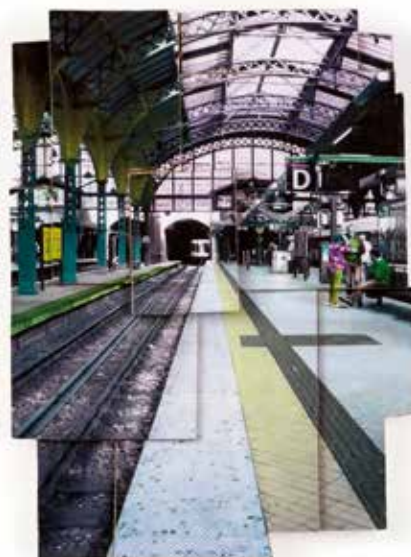
Vinst nr 337. Fotocollage på balsaträ, Opbruk , 16 x 12 av Marianne Markvard . Dansk konstnär, verksam i Århus: "Jag arbetar i lager på lager. Både i förhållande till bilders betydelse som rent fysiskt, i arbetet med måleri, collage, videofilm och installationer i rum."