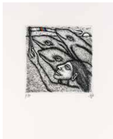
Vinst nr 363. Kolorerad etsning, Samma med delfiner , 11 x 10 av Gerald Steffe . Född 1939 i Linz, Österrike. Han är sedan 1962 bosatt och verksam grafiker i Stockholm.