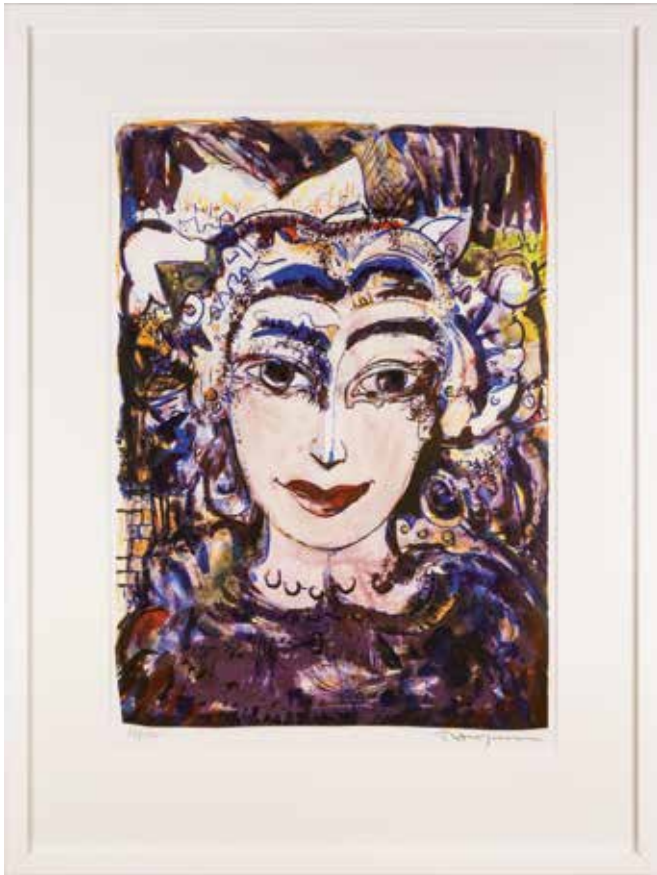
Vinst 30-92. Färglitografi, Margarita i NYC , 42 x 29 av Torsten Jurell.