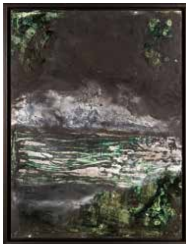
Vinst nr 11. Målning, Landskap 40 x 30 av Sofia Heinonen . "I måleriet undersöker jag förhållandet mellan abstraktion och natur. Jag inspireras av naturens egenskaper. Betydande drag, som att naturen är i en ständig visuell omvandling och där finns en oförutsägbar energi. Detta formspråk tar jag med mig i min måleriska process."

Om du inte hade tur vid årets dragning i medlemslotteriet, kan du köpa någon av