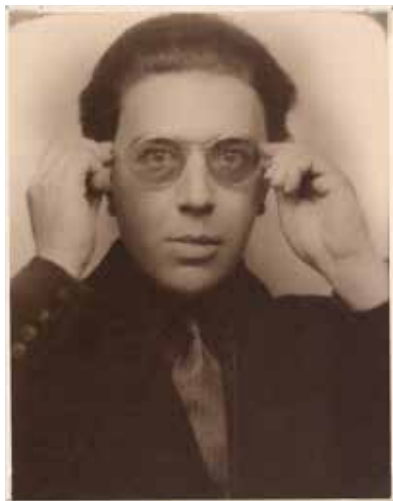
André Breton, 1924.