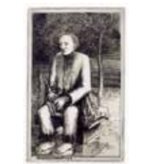
Melankolivariation II , stålstick av Richard Ärlin, 2006. Pris 1000:- 9 x 6 cm.