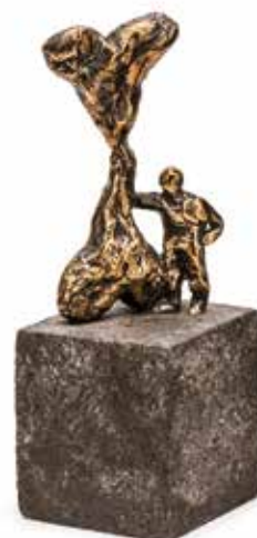
Vinst nr 299. Bronsskulptur, unik, Man med dubbelhjärta , 15 x 6 x 5 av Susanne Kirså . Susanne Kirså är en dansk konstnär med skulptur som främsta uttrycksmedel. Hon arbetar i brons där de flesta skulpturerna gjuts i ett enda exemplar. Hon behärskar hela proceduren inklusive gjutningen fram till den färdiga skulpturen.

Cantrells glaskonst har beröringspunkter med POP-konst och tecknade serier med ett personligt anslag.