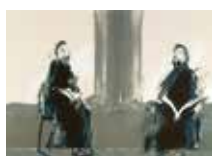
Två kvinnor , färglitografi av Örjan Wikström. 1986. Pris 1500:- 45 x 60 cm.