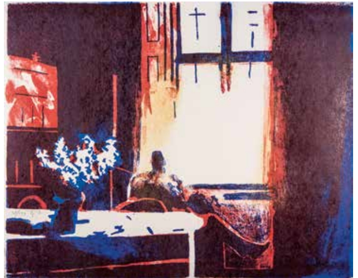
Vinst nr 298. Handtryckt stenlitografi, Vid fönstret , 40 x 50 av Örjan Wikström . Född 1948 i Stockholm. Bosatt i Paris och Stockholm. Utbildad vid Konstfack, Stockholm och Konstakademien, Paris