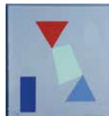
Figurspel I , serigraf av Ingela Palmertz. 2003. Pris 2200:- 41 x 38 cm.